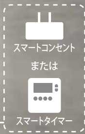
スマートコンセント